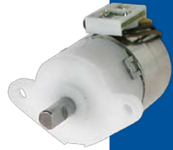
PG Type Motors