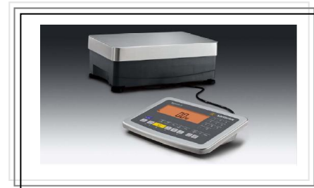
No. 217SIWRDCP (SMI)-A