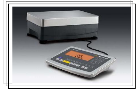
No. 217SIWSDCP (SMI)-A