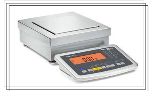
No. 217SIWSBBS (SMI)-A