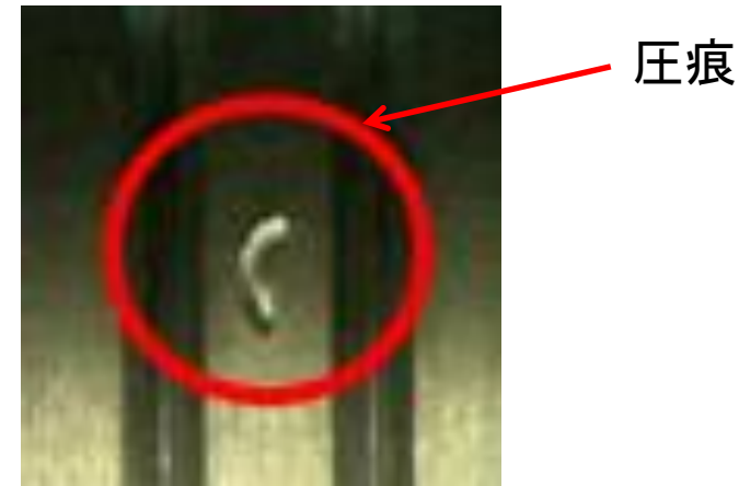
【Wavy Nozzle設置前後での圧痕頻度比較】