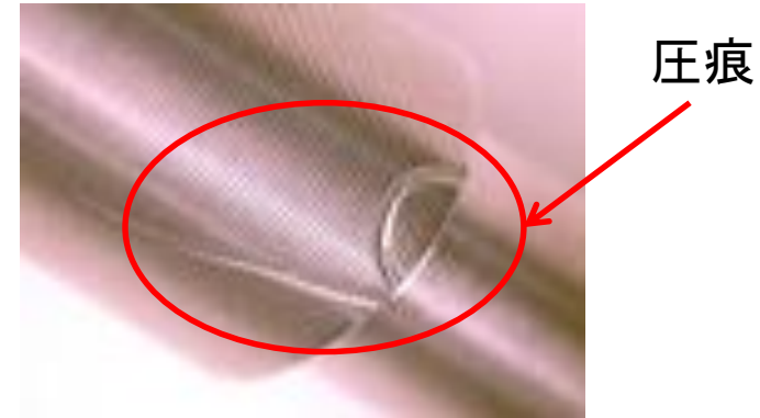
【Wavy Nozzle設置前後での圧痕頻度比較】